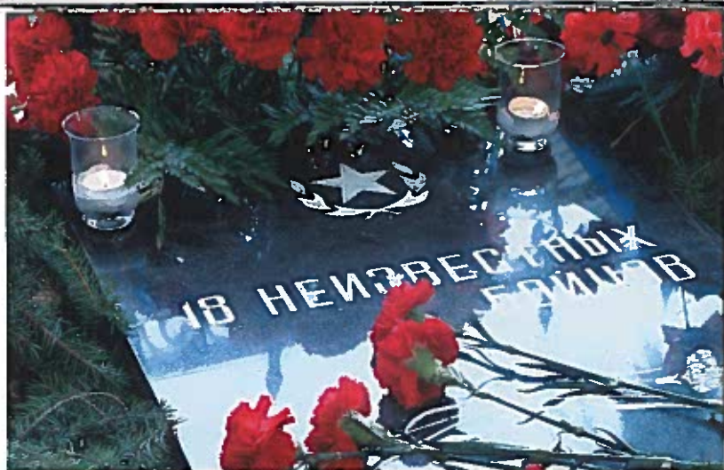
Надгробие. Братское кладбище

Памятник установили комсомольцы термообрубного цеха Тихвинских производств объединения «Кировский завод», один из инициаторов — секре-