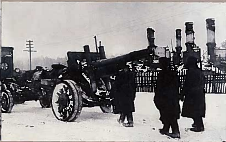
Советская тяжелая артиллерия проходит по улице освобожденного города на новые позиции. Тихвин. Декабрь 1941 г.

ны СССР, представитель Ставки Верховного Главнокомандующего на фронтах, командующий 7-й и 4-й армиями. Руководил Тихвинской наступательной операцией. 4-й армией под командованием генерала К. А. Мерецкова был освобожден г. Тихвин. Командовал Волховским, Карельским и 1-м Дальневосточным фронтами. С 1944 г. — Маршал Советского Союза. Похоронен в Москве на Красной площади.