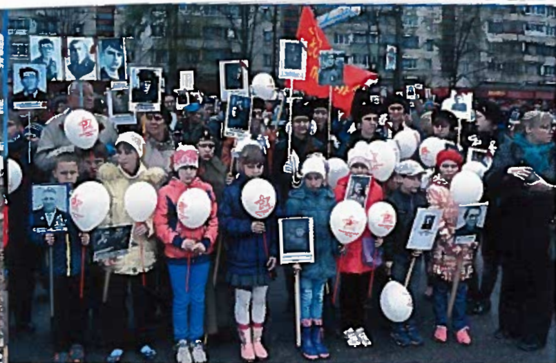
Тихвинцы в строю «Бессмертного полка». Пл. Мерецкова, 9 мая 2014 г.