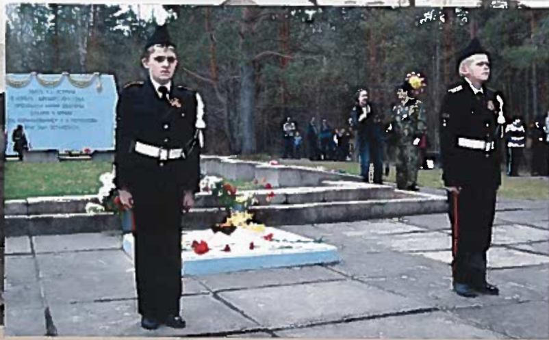
Кадетский почетный караул у Вечного огня Мемориальный комплекс в дер. Астрача. 9 мая 2013 г.