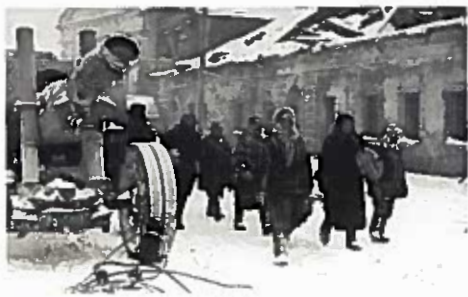
Возвращение в освобожденный Тихвин. Декабрь 1941 г.

отхода на запад и северо-запад. Немцы предприняли ряд мощных атак, тяжелые бои шли на окраинах Тихвина, в районе дер. Лазаревичи. Войска оперативной группы генерала А. А. Павловича взяли деревни Ново-Андреево и Шибенец, перерезав дорогу Тихвин – Будогощь.