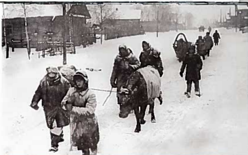
Тихвинцы возвращаются в освобожденный от немецко-фашистских захватчиков город Тихвин. Декабрь 1941 г.

22 октября 1949 г. сюда были перенесены останки воинов из