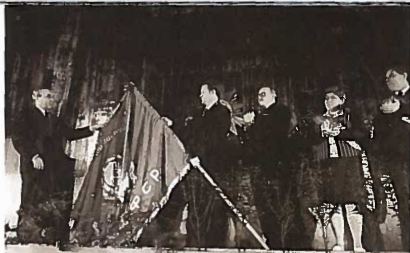
Первый секретарь Ленинградского областного комитета КПСС Г. В. Романов прикрепляет к знамени Тихвина орден Отечественной войны I степени. Торжественное собрание трудящихся города. Районный Дом культуры в декабре 1974 г.