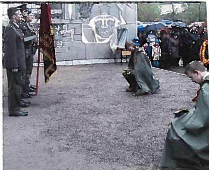
Торжественно-траурный митинг. Братское кладбище, 9 мая 2008 г.