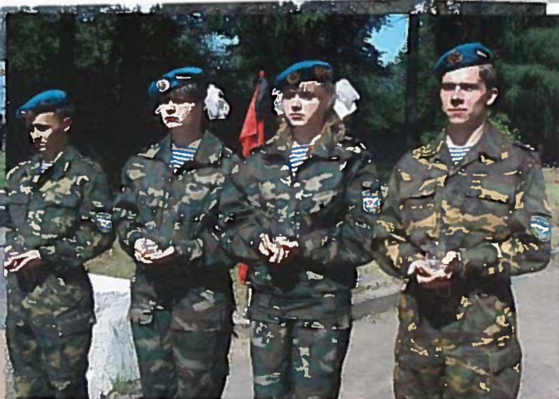
Минута молчания. Воспитанники клуба «Десант». 22 июня 2008 г.