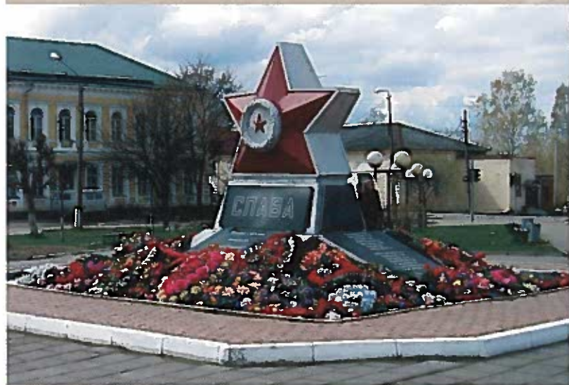
Памятник «Слава героям». Пл. Свободы