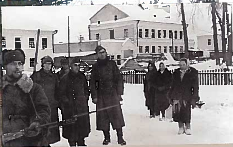
Красноармейцы ведут пленных фашистов по улицам освобожденного города Ул. Советская. 18 декабря 1941 г. Фотограф В. С. Тарасевич