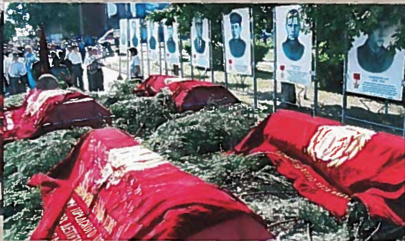
Траурное шествие. Пл. Свободы. 22 июня 2008 г.

23 октября 1949 г. сюда были перенесены останки воинов из деревень и хуторов Бор, Кайвакса, Шомушка, Плаун и Вехтуй, установлен первый памятник.