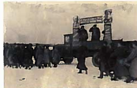
Торжественный митинг личного состава 815-го истребительного авиаполка в честь награждения орденом Красного Знамени за бои под Тихвином. Декабрь 1941 г.

Над немецкими войсками нависла угроза окружения. Понимая это и стремясь удержать Тихвин, в конце ноября –