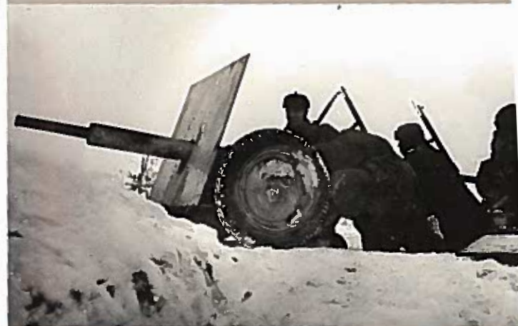
Артиллерийский расчет ведет огонь по фашистским захватчикам Тихвин. Декабрь 1941 г.