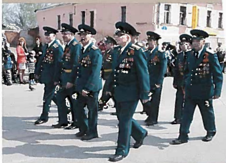
Члены Союза офицеров запаса и в отставке на параде, посвященном 65-летию Великой Победы. Ул. Карла Маркса. 9 мая 2010 г.