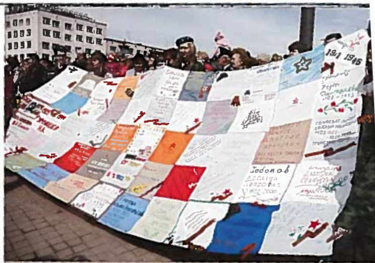
Воспитанники клуба «Десант» демонстрируют полотнище, составленное из подготовленных тихвинцами «солдатских платков» Пл. Мерецкова, 9 мая 2012 г.