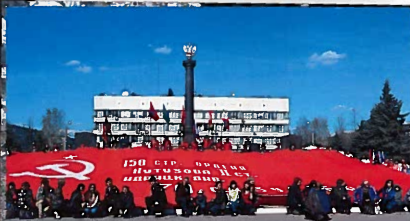
Масштабная копия Знамени Победы, доставленная в Тихвин участниками международного автопробега «Дорогами Победы» Пл. Мерецкого. 27 апреля 2014 г.