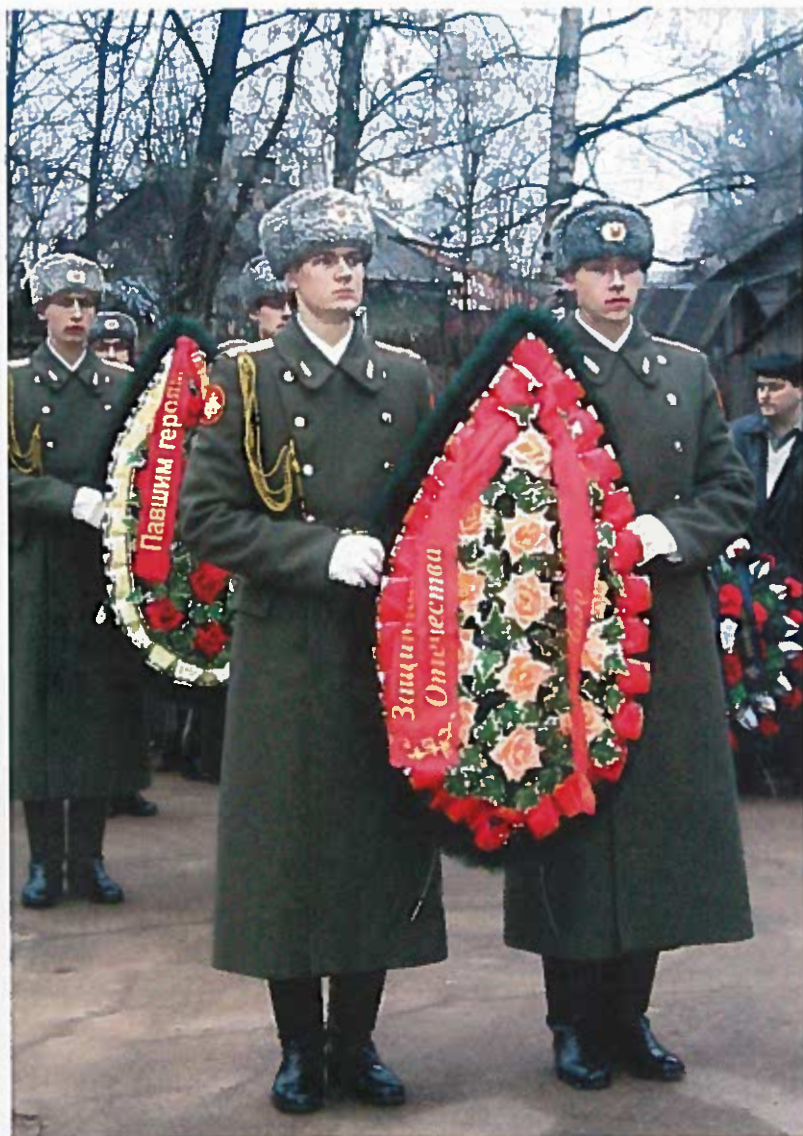
Военнослужащие Ленинградского военного округа готовятся к возложению венков. Братское кладбище. 9 мая 2005 г.