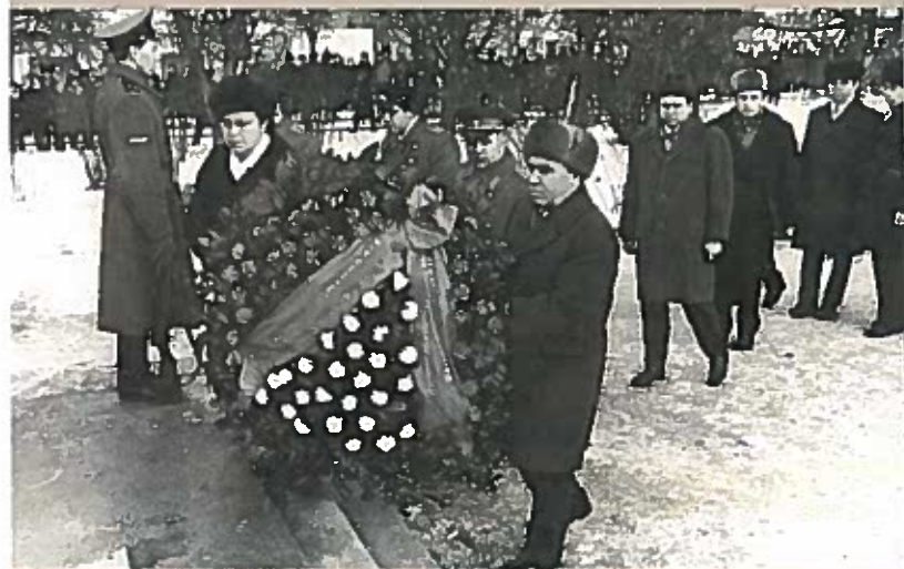
Первый секретарь Ленинградского областного комитета КПСС Г. В. Романов и заместитель председателя Ленинградского областного исполнительного комитета Т. И. Мотова возлагают венок к памятнику «Слава героям» Пл. Свободы. 8 декабря 1974 г.