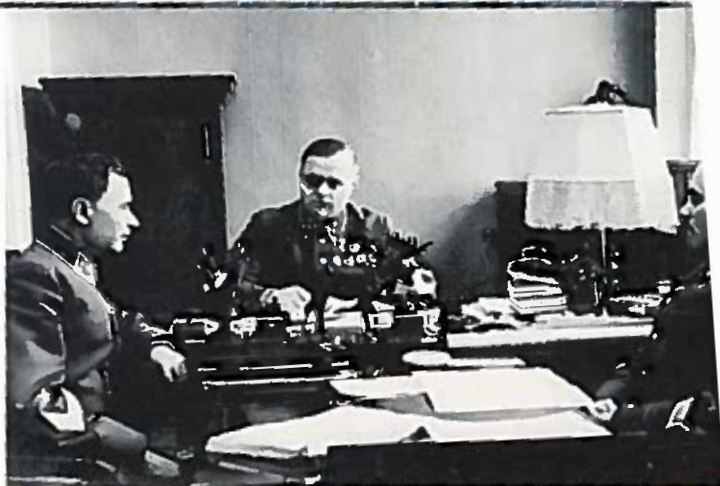
Совещание в кабинете у генерала армии К. А. Мерецкова (в центре). 1941–1942 г.