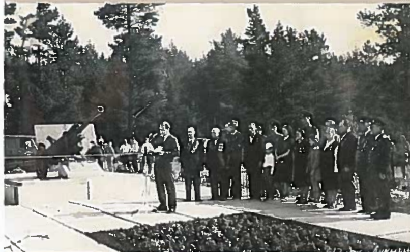
Открытие мемориала «Пушка». 1975 г.