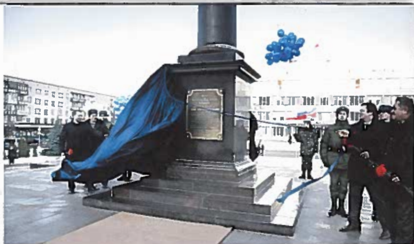
Торжественное открытие стелы «Город воинской славы» пл. Мерецкова. 9 декабря 2011 г.

Стела является типовой и в соответствии с Федеральным законом № 68-ФЗ от 9 мая 2006 г. «О почетном звании Российской Федерации «Город воинской славы» устанавливается во всех городах, удостоенных этого высокого звания. Ее проект победил на проходившем в 2008 г. в Москве открытом Всероссийском конкурсе на лучший архитектурно-скульптурный проект стелы, и 27 января 2009 г. был одо-