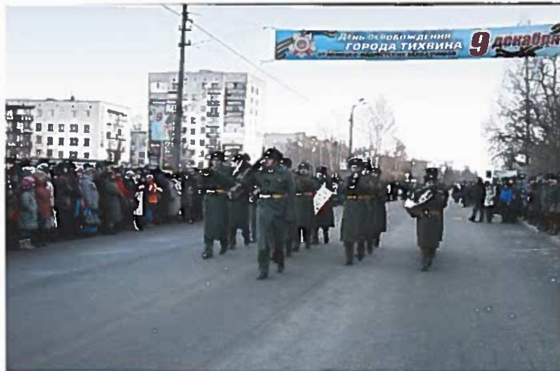
Военнослужащие Ленинградского военного округа на праздновании 70-летия освобождения Тихвина от немецко-фашистских захватчиков Пл. Мерецкова, 9 декабря 2011 г.