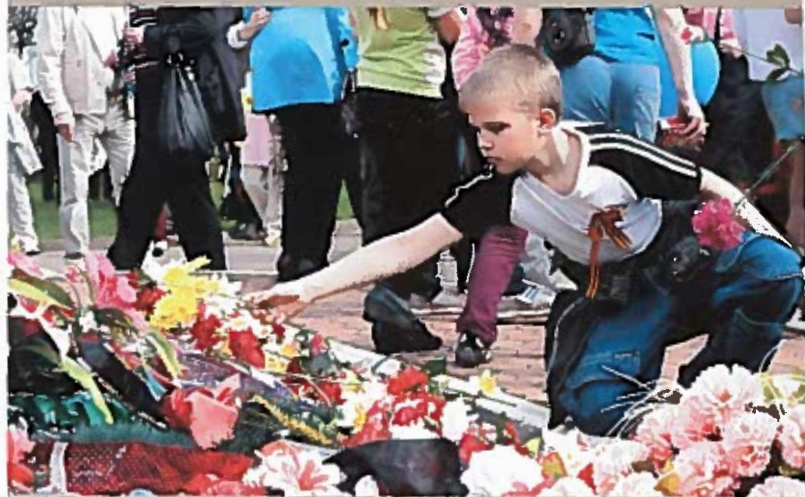
Юный тихвинец возлагает цветы к памятнику «Слава героям» Пл. Свободы, 9 мая 2010 г.