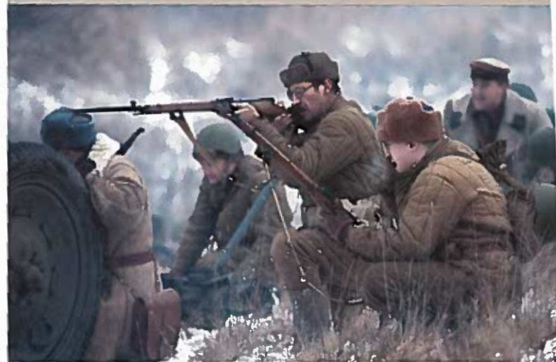
Эпизод реконструкции сражения за Тихвин в декабре 1941 г. Квартал Николина Гора. 7 декабря 2014 г.