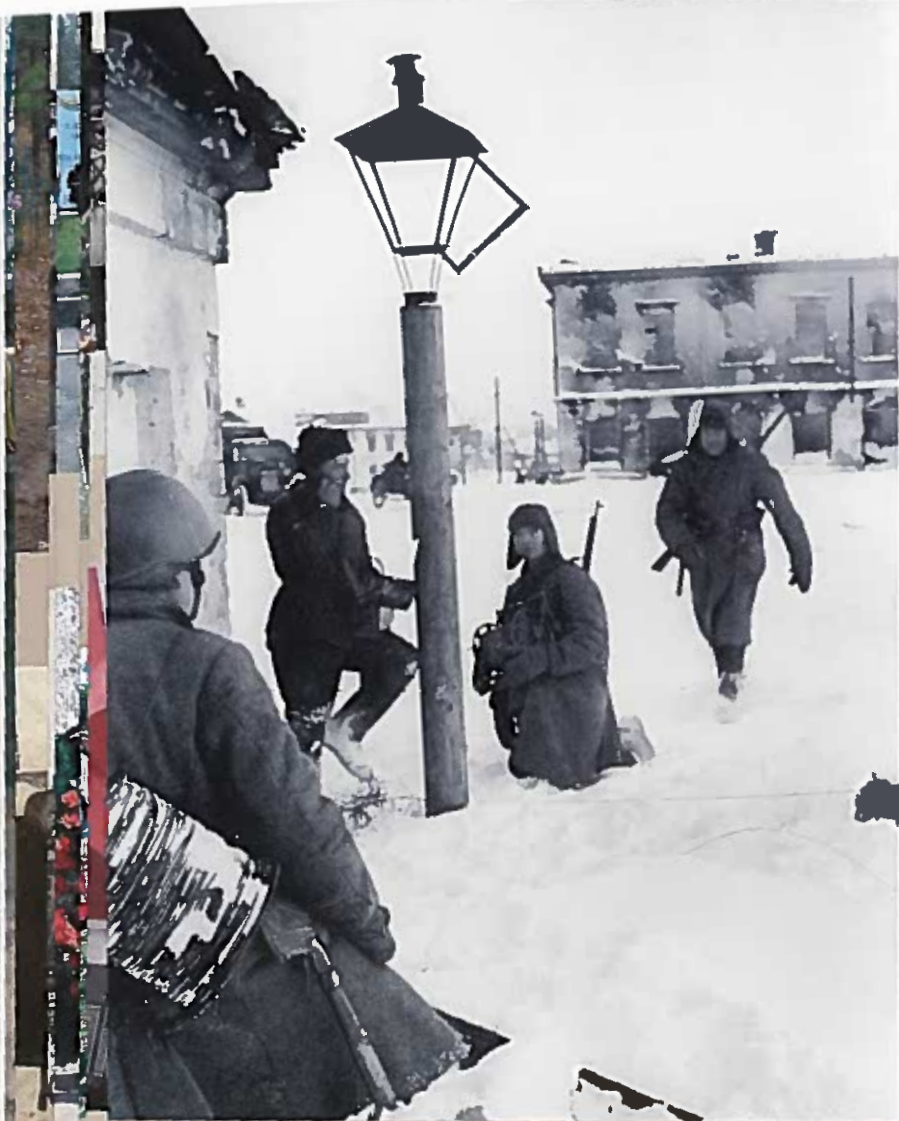
Связисты восстанавливают телефонную линию после освобождения города. Тихвин, Декабрь 1941 г.

за Родину 1941–1944». Существующий памятник был установлен в 2014 г.