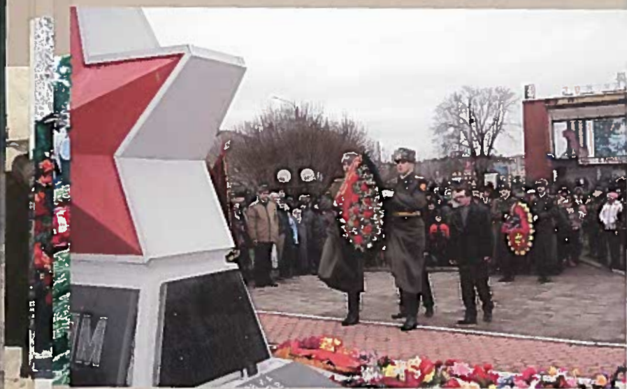
Военнослужащие Ленинградского военного округа возлагают венки к памятнику «Слава героям». Пл. Свободы, 9 мая 2005 г.

дер. Новый Выселок и местечка Пастуший Луг; в 1959 г. – из дер. Рапля. Всего захоронено 40 человек (известны 10 фамилий). Памятник установлен в 1977 г.