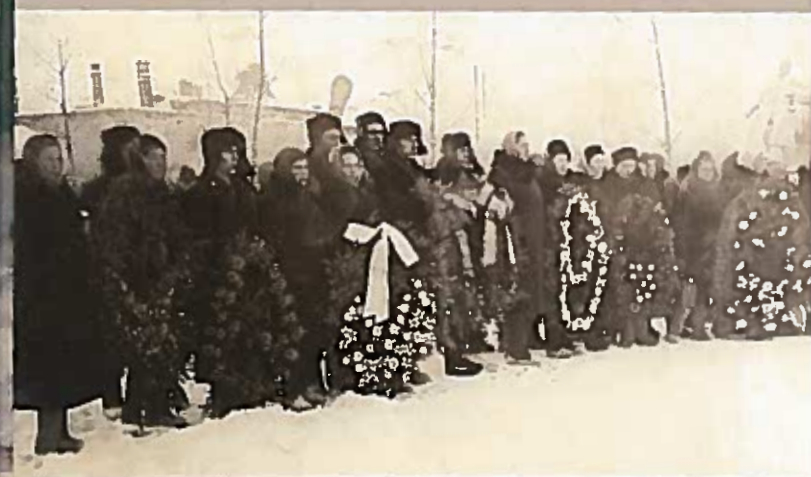
Минута молчания. Пл. Свободы. 1940-е гг.