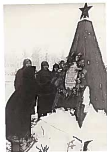
Деревянный обелиск на пл. Свободы. 1942 г.

го лейтенанта В. М. Зайца. Надписи на памятнике: «С героям, отдавшим свою жизнь за освобождение города вина 9 декабря 1941 г., немецко-фашистских захватчиков», «Слава героям Великой Отечественной войны 1941–1945 гг., павшим за свободу и независимость».