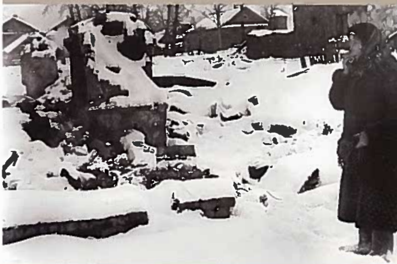
Женщина у родного дома, сожженного фашистами Тихвин. Декабрь 1941 г.