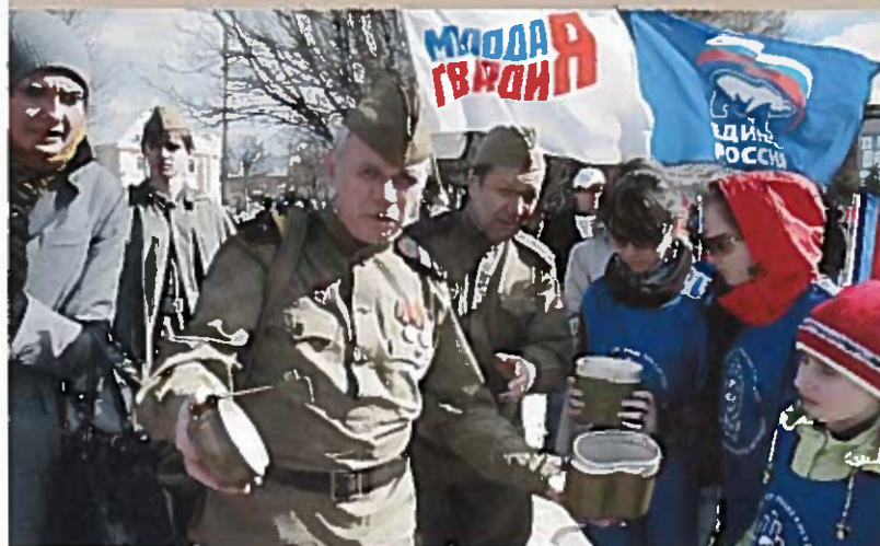
Участники международной молодежной экспедиции «Дорогами Победы – дорогами мира и дружбы». Пл. Свободы, 19 апреля 2011 г.