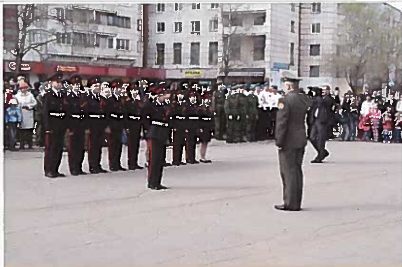
Кадетский класс школы № 6 участвует в традиционном смотре строя и песни, посвященном Дню Победы. Пл. Мерецкова, 9 мая 2013 г.