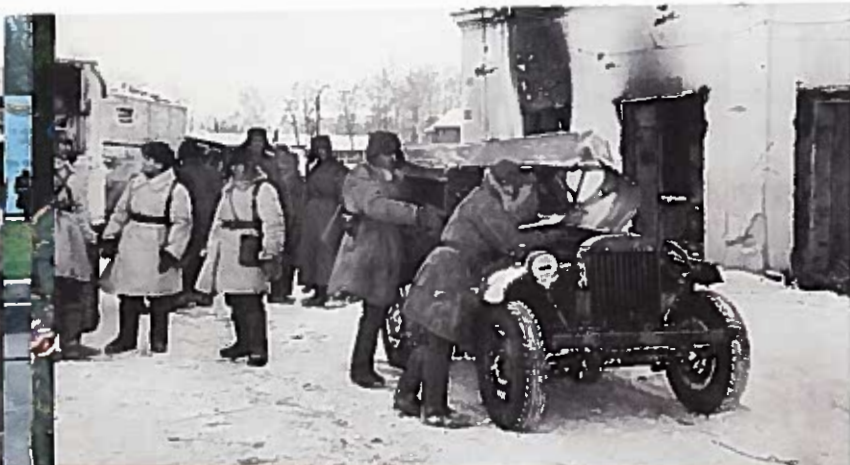
Советские бойцы в освобожденном городе. Тихвин. Декабрь 1941 г.