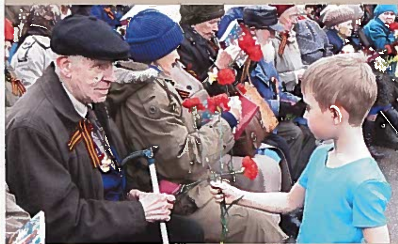
Цветы победителям. Пл. Свободы, 2008 г.

вместе со своим предшественником Т-34-76 решающую роль во многих сражениях. Знаменитая «тридцатьчетверка», разработанная КБ танкового отдела Харьковского завода № 183 под руководством М. И. Кошкина, была принята на вооружение 19 декабря 1939 г., и этот танк, единственный в мире, находился в серийном производстве до конца войны. Памятник установлен на месте Пашского кордона, в 1941 г. превращенного немцами в укрепленный опорный пункт