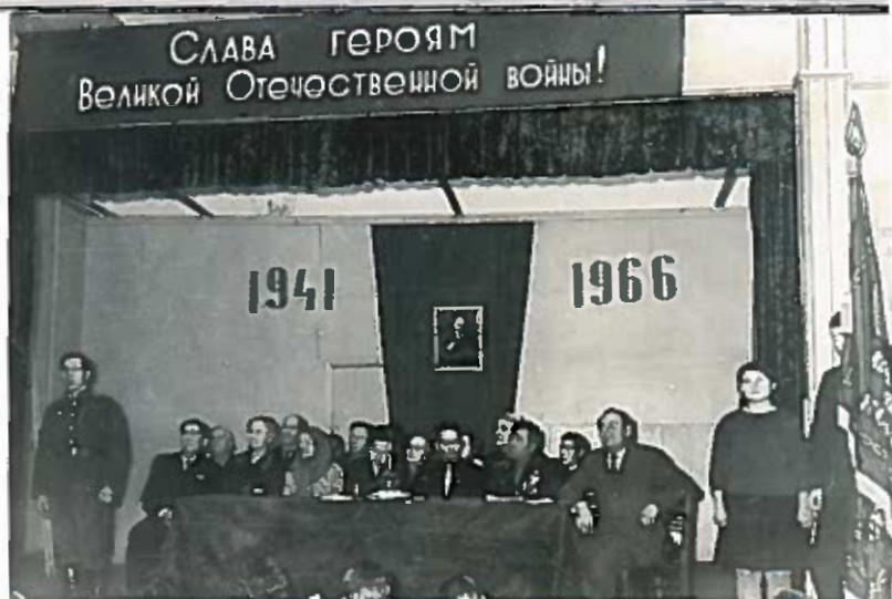
Торжественное мероприятие в честь празднования 25-й годовщины освобождения Тихвина от немецко-фашистских захватчиков. Районный Дом культуры. 1966 г.