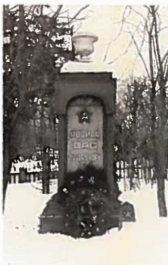
Обелиск «Родина вас не забудет» Братское кладбище. 1949-е гг.