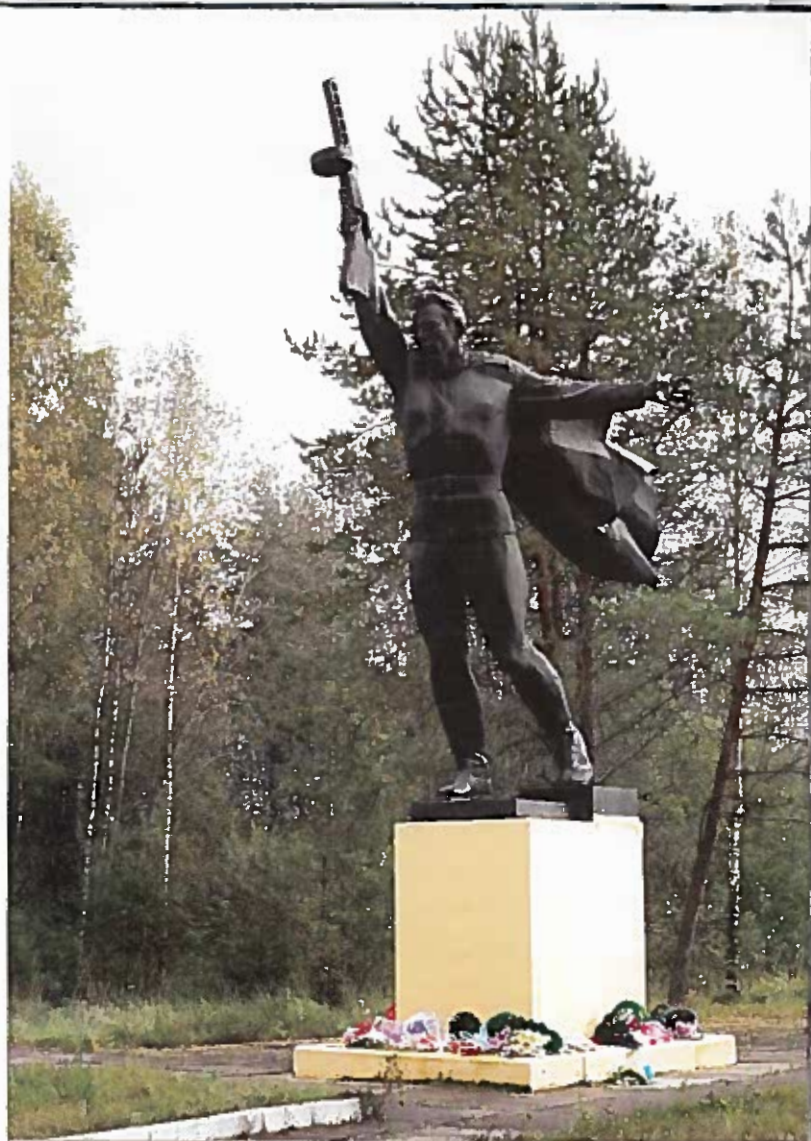
Памятник Солдату. Мемориальный комплекс в дер. Астрача