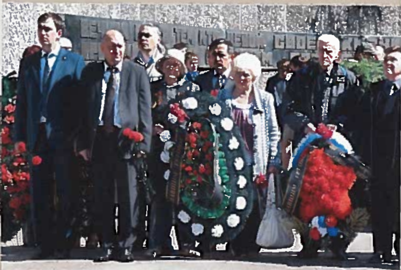
Торжественно-траурный митинг. Братское кладбище 22 июня 2014 г.

здесь покоятся 3456 человек. Обелиск был открыт 9 декабря 1949 г. Перед входом на братское кладбище — стена с барельефным изображением воина. На ней надпись: «Вечная слава тем, кто ценой своей жизни проложил дорогу грядущим поколениям».