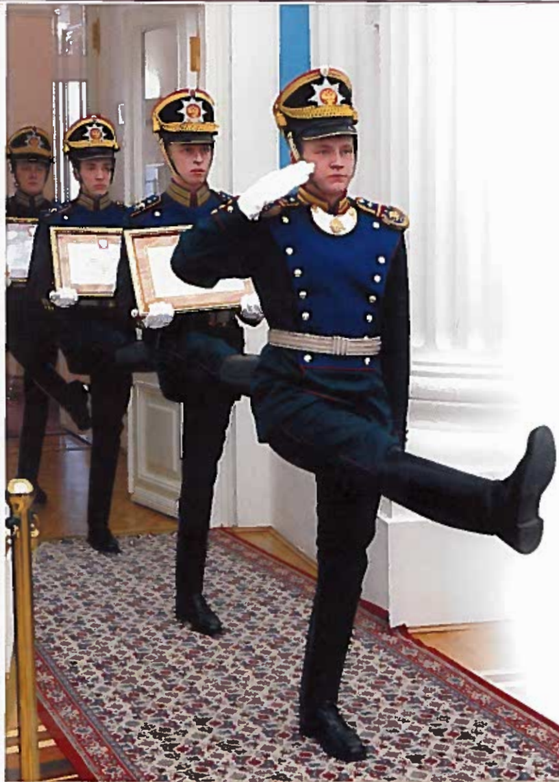
Церемония вручения грамот Президента России «Город воинской славы» городам Владивосток, Тверь и Тихвин. Москва, 23 февраля 2011 г.