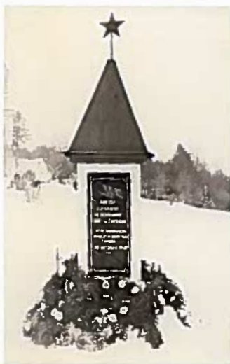
Обелиск воинам, погибшим в боях за освобождение Тихвина Братское кладбище. 1949 г.