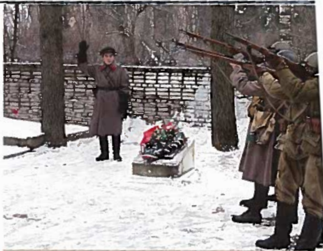
Участники петербургских клубов исторической реконструкции салютуют воинам, павшим на тихвинской земле. Братское кладбище. 7 декабря 20