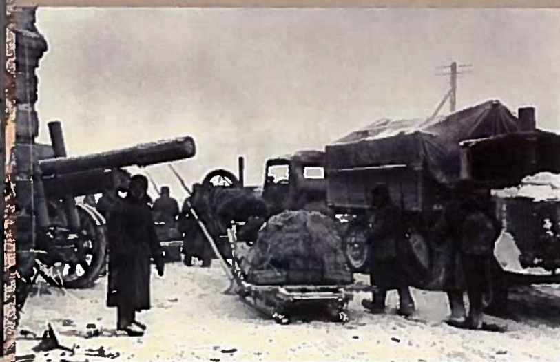
На улице города, освобожденного от фашистских захватчиков Тихвин. Декабрь 1941 г.

дер. Григино, Шугозерское сельское поселение ПАМЯТНИК. 2008 г. 49 70 ФАМИЛИЙ