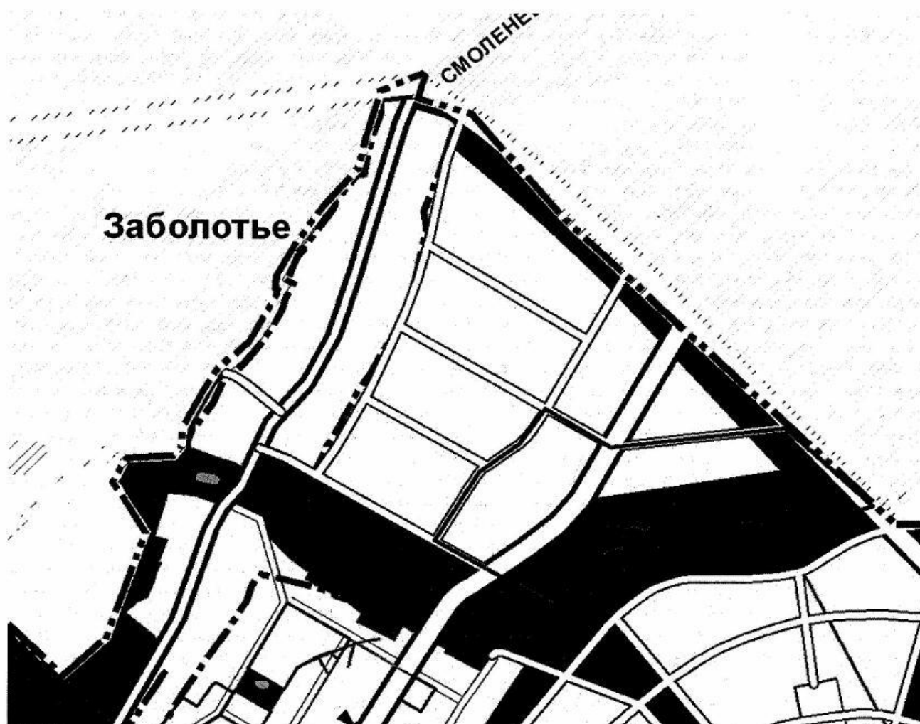
Схема границ территории проектирования